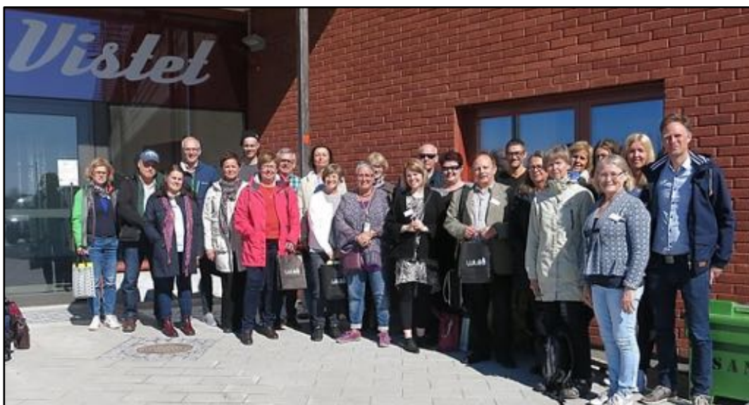
Glada deltagare på Regionkonferensen i Sunderbyn