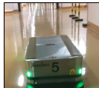
Robot nr 5, "Karolinus" , i kulverten på Nya karolinska Sjukhuset,

E-post: agneta.lindh.wennefjord@ uppsala.se