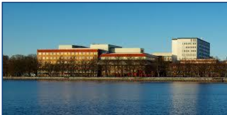
Centrallasarettet i Växjö