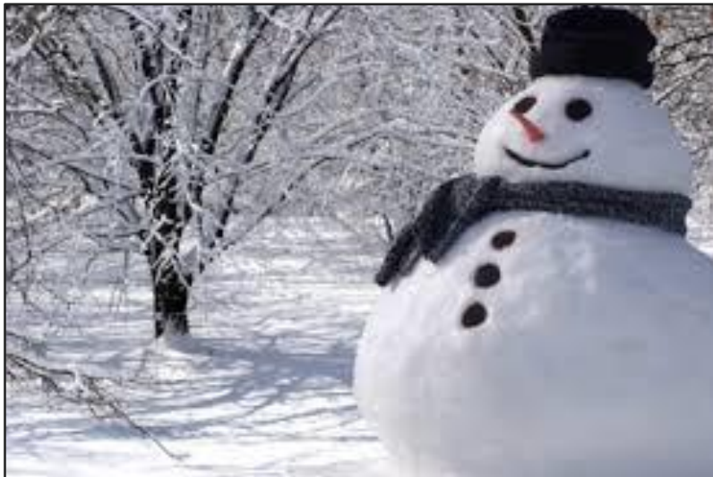
Snögubbe i Stadsträdgården, Uppsala, november 2016.

En riktigt GOD JUL och ett GOTT NYTT ÅR 2017 önskar jag Er Alla!