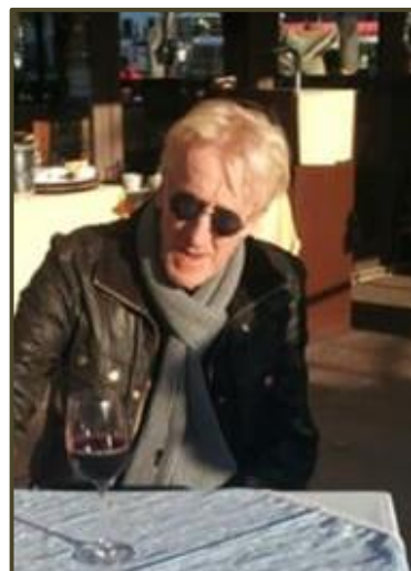
På semester i Venedig