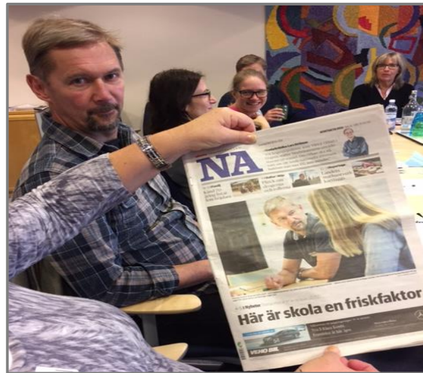
Reklam för BUP-skolan i Närkes Allehanda